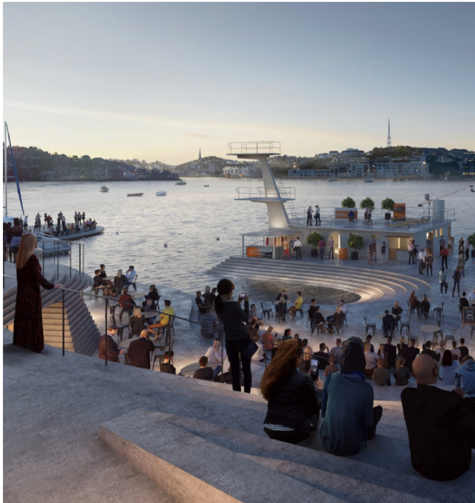
STORE PLANER: Kulturformidling og miljø står sterkt når initiativtakerne bak Knubben-prosjektet planlegger framtida til badeholmen.

– Tanken er å bruke en flytscene som også kan brukes i Pollen, i Barbu eller hvor som helst. Vi kan sette opp produksjonen på land